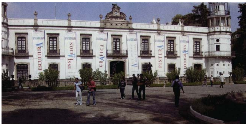
Museet. Den bruna öppna dörren på höger sida är ingången till Diego Riveras museum och hans ateljé. Öppet för allmänheten mot avgift och guide.

En av anledningarna till resan var längtan efter att få se Diego Riveras och Frida Kahlos målningar i verkligheten och att få besöka Fridas hem där hon arbetade och bodde. Det blå huset ligger i Mexico City i en lugn och behaglig stadsdel.