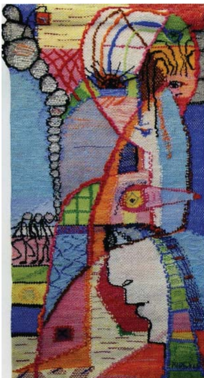
"Improvisation", väv och broderi ©A Nyberg/BUS 2009

Basen är den textila verksamheten och där spenderar jag mest tid. Men de olika sätten att uttrycka sig på behöver varandra för utveckling och mognad. Det är ett samarbete.