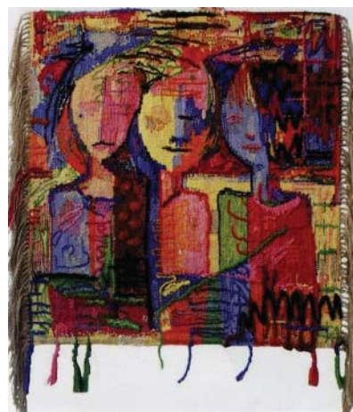
"Ut ur tystnaden", väv och broderi ©A Nyberg/BUS 2009